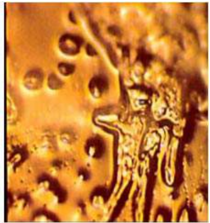
Je te hais

Pour en savoir plus, voici des liens de vidéos que vous pouvez visionner :